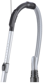
Mekanik emiş gücü ayar tuşu