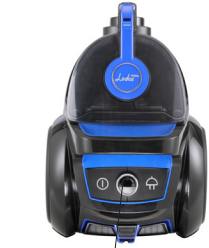
Elektronik emiş gücü ayar tuşu